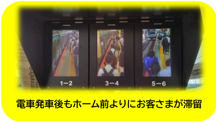
電車発車後もホーム前よりにお客さまが滞留