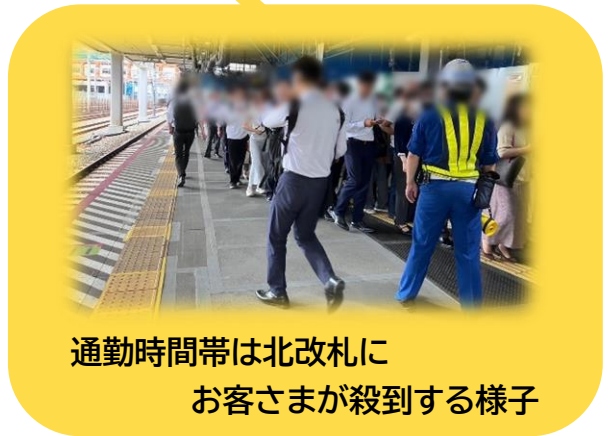
通勤時間帯は北改札に お客さまが殺到する様子

現在、浜松町駅では駅改良工事の為、内回りホーム・外回りホームどちらも北改札側のホームが仮囲い等で狭くなっています。特に通勤・通学時間帯は多くのお客さまが利用するためホーム上にも人が溢れ、触車やホーム上から転落の恐れが高まっています。東京支部は6月27日に現地調査を行い、今後は今回の調査をもとに関係分会と意見交換を開催し、職場の仲間と「安全」をつくりだしていきます！